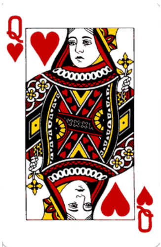
扑克牌中女王的图片是依据伊丽莎白的肖像。